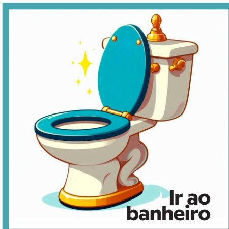
Ir ao banheiro