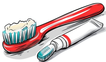
Escovar os dentes