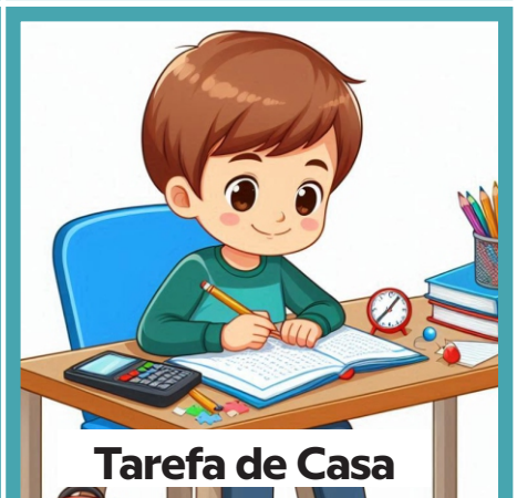
Tarefa de Casa