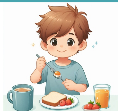
Tomar café da manhã