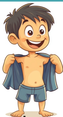
Trocar de roupa