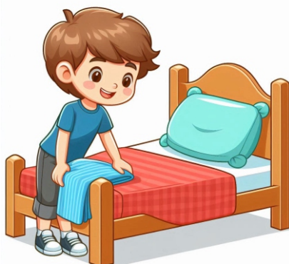
Arrumar a cama