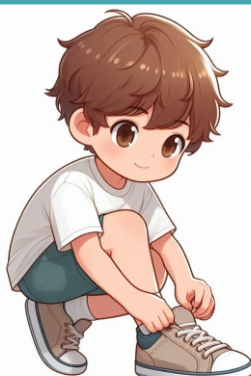
Trocar de roupa