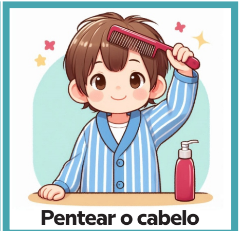
Pentear o cabelo