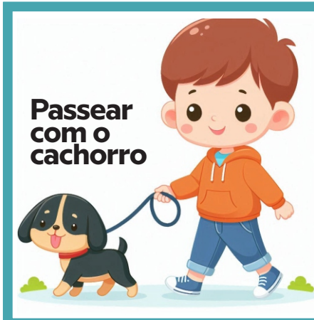
Passear com o cachorro