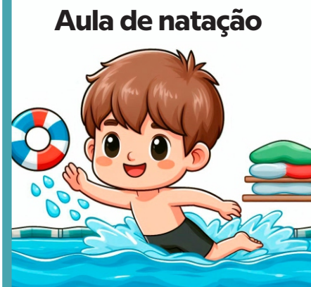
Aula de natação