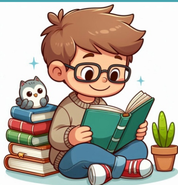
Hora da leitura