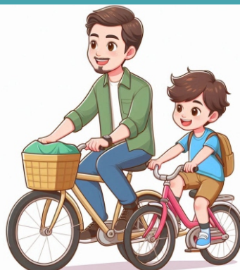
Andar de Bicicleta