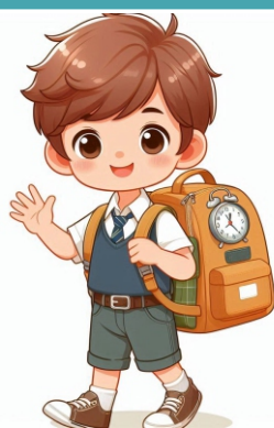
Ir para a escola