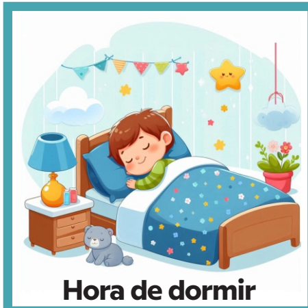
Hora de dormir