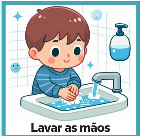
Lavar as mãos