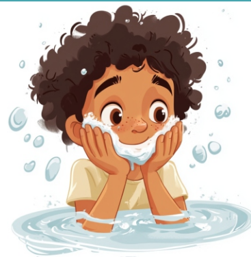
Lavar o rosto