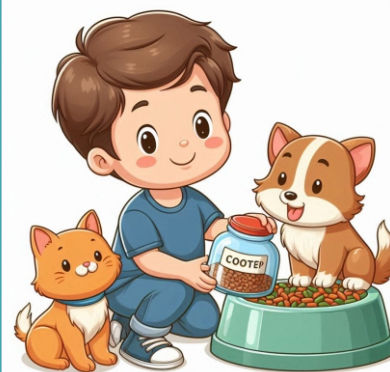
Alimentar os pets