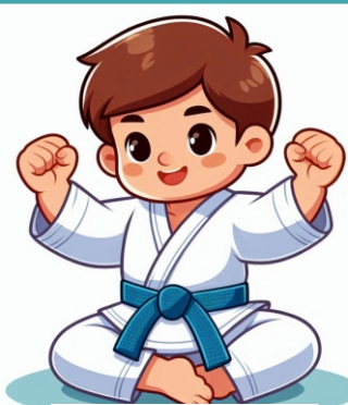
Aula de Judô