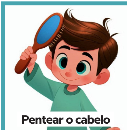
Pentear o cabelo